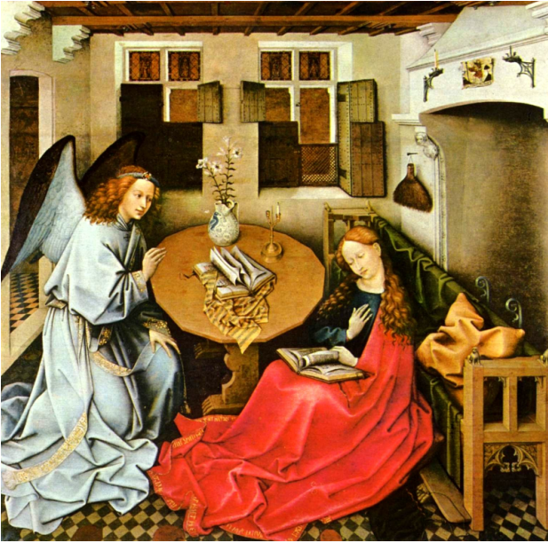
Der Erzengel Gabriel verkündet der Jungfrau Maria die Ankunft des Herrn. Ölgemälde von Robert Campin, 1420–1440, Brüssel

Advent ist nicht einfach die Vorfreude und Vorbereitung von Weihnachten, der Geburt unseres Erlösers. Advent soll auch die Hoffnung auf das Wiederkommen Christi am Ende der Tage sein für uns Christinnen und Christen und die Glaubensgewissheit: Gott ist als Mensch zu seinen Menschen, zu seiner Schöpfung gekommen.